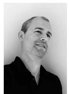
Pablo F. Díaz-Fierros Dr. Arquitecto y fotógrafo de arquitectura. http://pablodiazfierros.com/