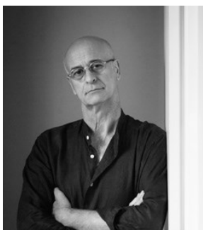
Fernando Alda Fotógrafo de arquitectura. http://www.fernandoalda.com/