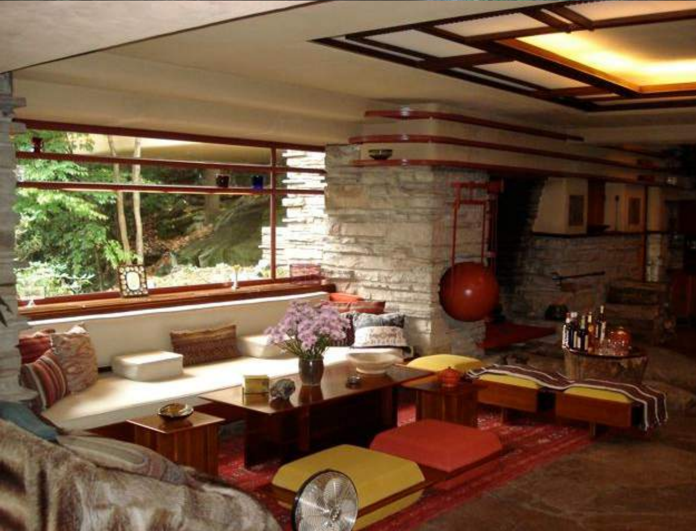
01 y 02 - Fallingwater, Frank Lloyd Wright (1935)