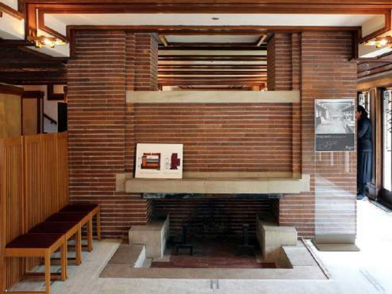
01 - Casa Robie, Frank Lloyd Wright (1910) 02 - Andy's Jazz Club & Restaurant