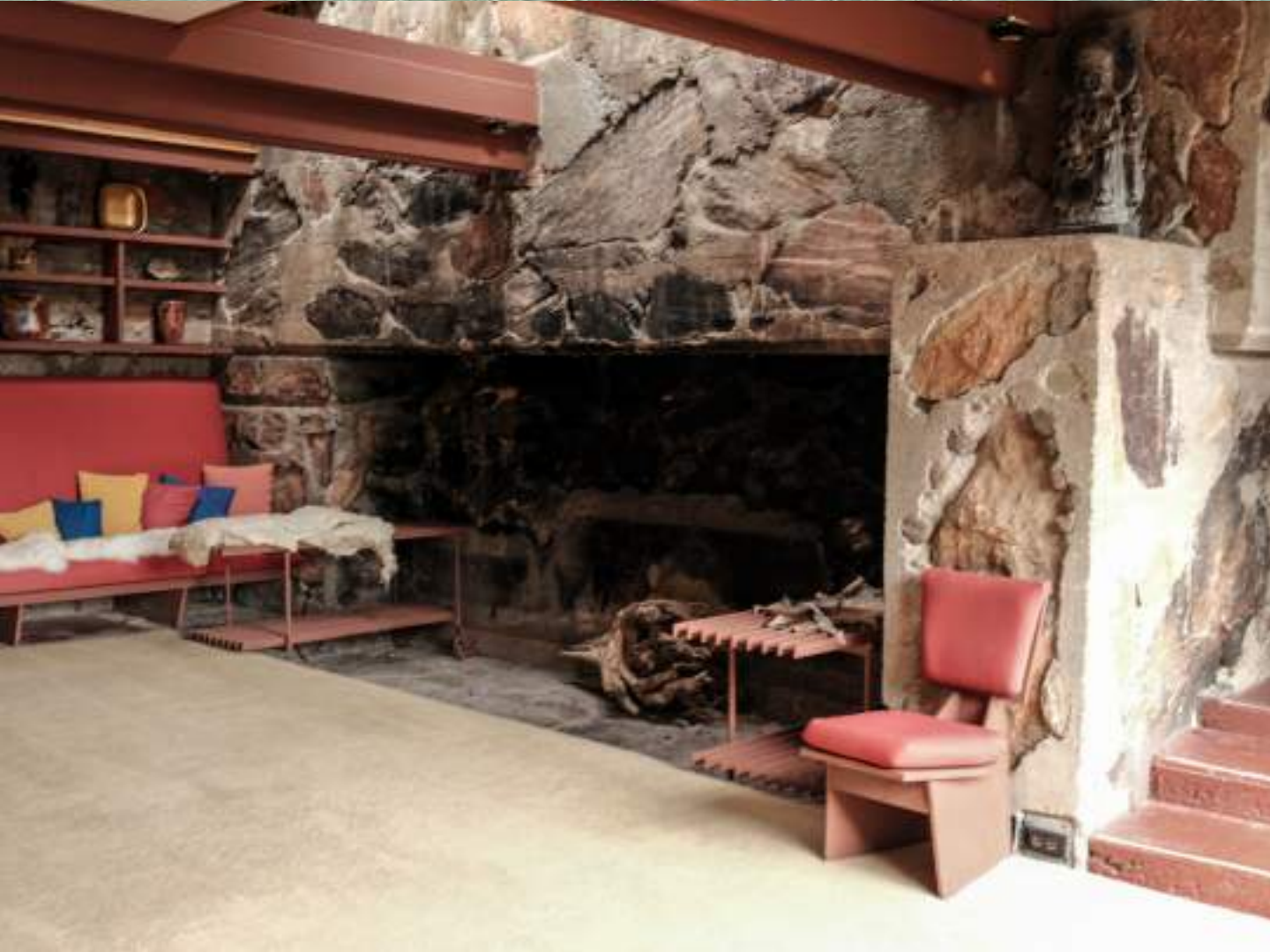
01 y 02 - Taliesin West, Frank Lloyd Wright (1937)