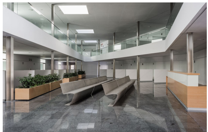
Centro de Salud Isla Chica. Javier Terrados. Fuente: www.javierterrados.com