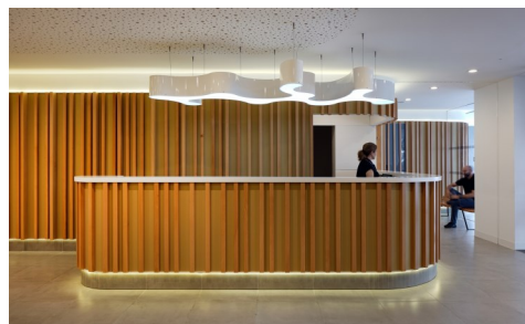
Instituto Oftalmológico Andaluz. Gabriel Verd Arquitectura