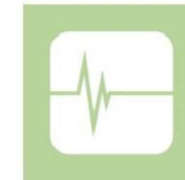
SALUD Y BIENESTAR