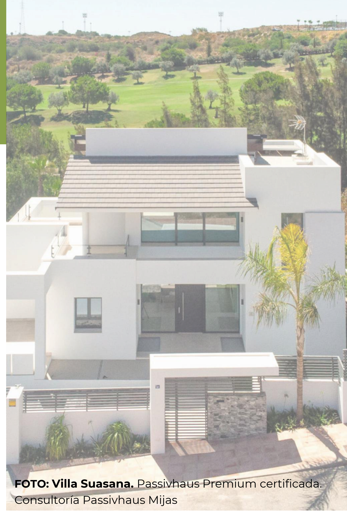
FOTO: Villa Suasana. Passivhaus Premium certificada. Consultoría Passivhaus Mijas

Se incluye una pausa para café, en la que el alumnado podrá charlar entre ellos y con los docentes, de manera que se potencia la interacción y el networking entre los integrantes del curso.