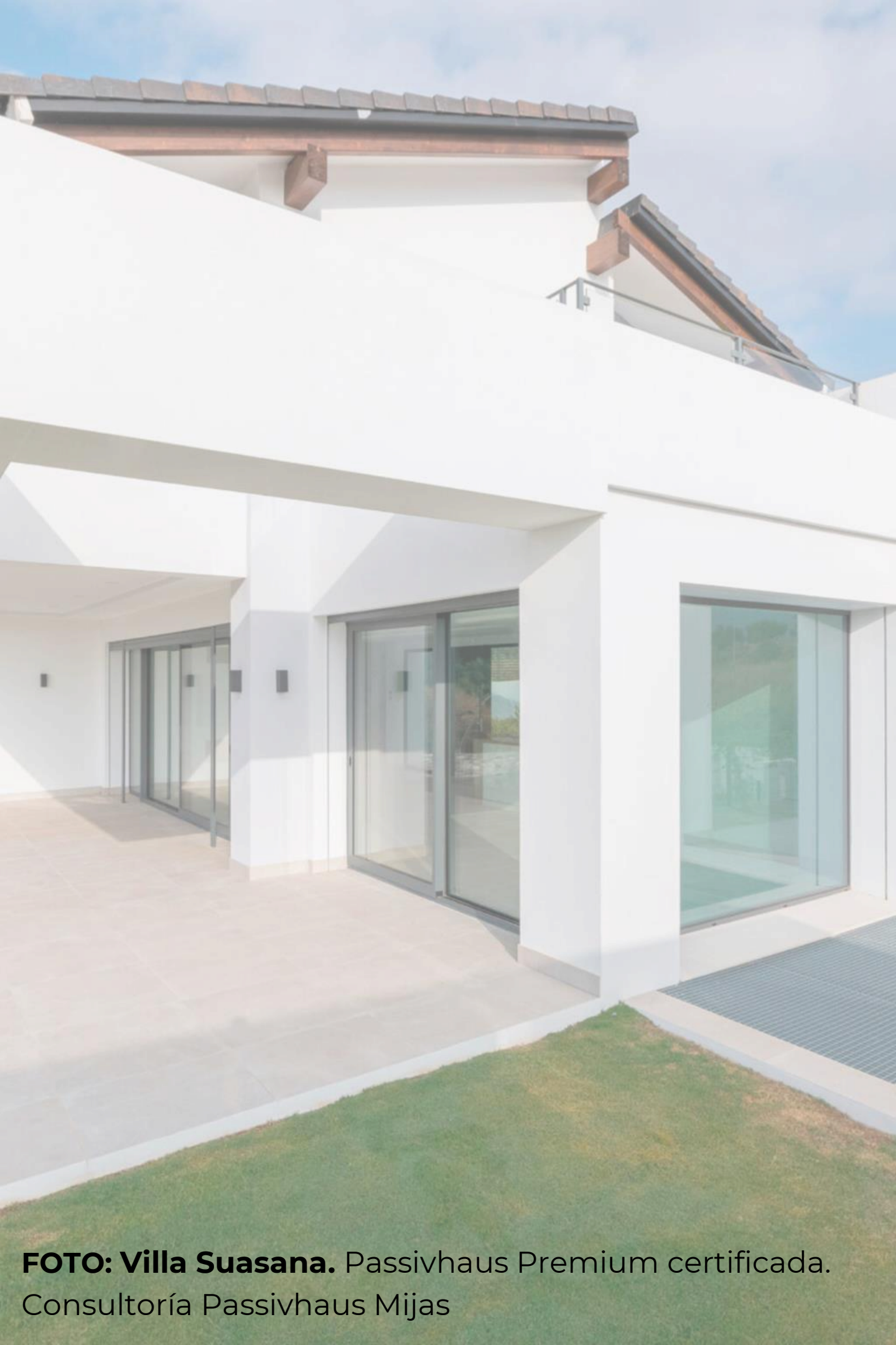
FOTO: Villa Suasana. Passivhaus Premium certificada. Consultoría Passivhaus Mijas

(OPCIONAL) EXAMEN OFICIAL Certified Passivhaus Designer: Julio 2024 | Fecha a confirmar por el PHI